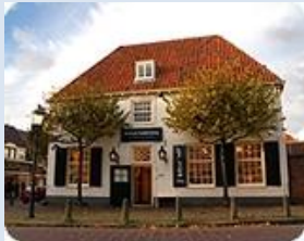
Amersfoort Achter de Kamp 2