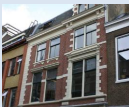
Utrecht Jansdam 4 bis