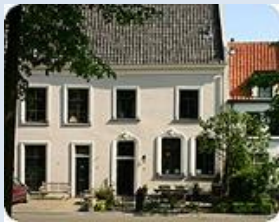
Harderwijk Vischmarkt 17