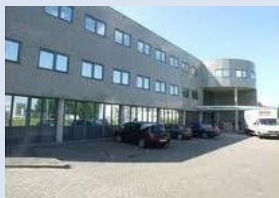
Almere Televisieweg 2

Het hoofdkantoor is gevestigd in Amersfoort. Hier worden ook de assessments afgenomen en vinden de trainingen plaats.